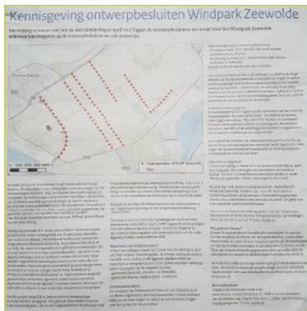
Bijna definitief ontwerpbesluit Windpark Zeewolde Laatste bezwaar mogelijk!