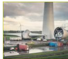
Mega windturbine in aanbouw bij Urk Dergelijke monsters komen ook heel dichtbij woningen in Almere Buiten, Almere Hout, Nobelhorst, Oosterwold.

Download hier het krantartikel uit het FD 'Hoge molens vangen veel wind'.pdf [1.189 KB]