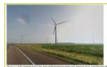
Dubbel zo hoog langs de hele A27 220 m volgens de plannen

Op zich staan de windmolens op Zeewolde grond maar de windmolenplannen raakt de Almeerse bevolking direct en niet die van Zeewolde want woonkernen in Zeewolde zijn ver weg. Hoe kan het dat Almere dat toestaat? Waarom zijn we al jaren geleden niet op de hoogte gesteld van de plannen?