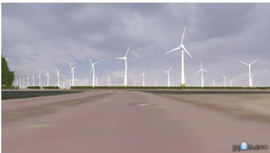
Figuur 6.4b: grote turbinetype (standpunt 6)