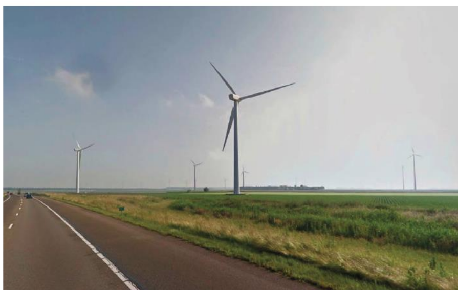
Figuur 5.7: Zicht vanaf de A27 op het open middengebied (turbines met ashoogte 67 m, rotordiameter 80 m)