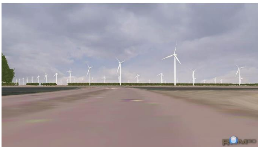
Figuur 6.4c: kleine turbinetype (standpunt 6)