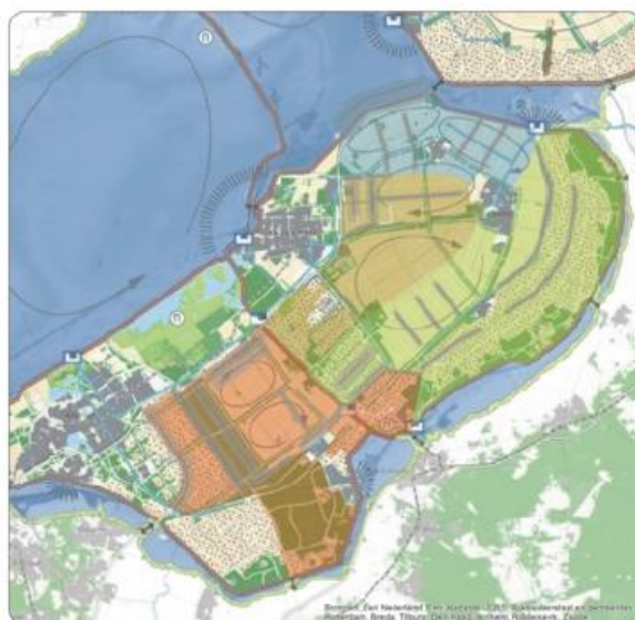
Ontwerp regioplan windenergie Flevoland