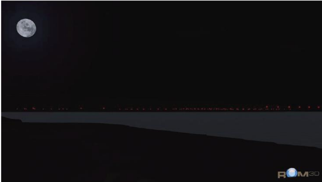
Figuur 6.6c: Alternatief O 150, nachtperiode (standpunt 9)